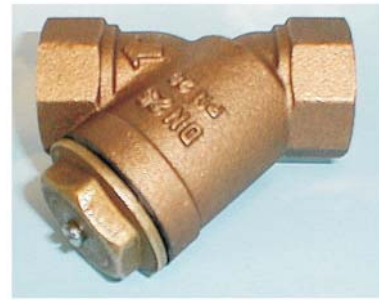
CTN-220, INV GÄNGA DN 20 - 100