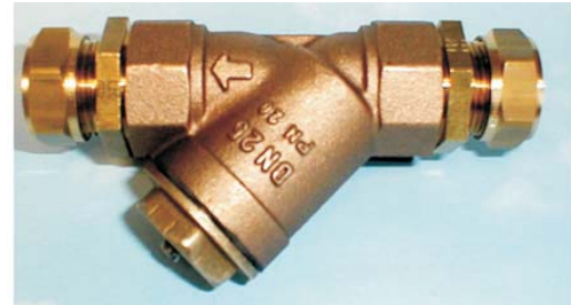
CTN-220, KLÄMRINGSKOPPLING DN 22 - 35

CTN-220 är ett magnetiskt filter med sil och är avsett för mindre värme- och kylanläggningar, värmepumpar mm för att "fånga upp" magnetit samt grövre föroreningar. Vid värmepumpar skyddar filtret värmeväxlaren från den isolerande magnetiten och man erhåller en avsevärt längre drifttid med bibehållen effekt. Filtret kan även användas för andra ändamål där såväl sil som magnetisk avskiljare erfordras.