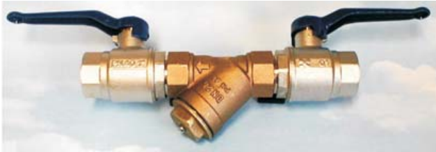
CTN-220V FILTER MED TVÅ VENTILER